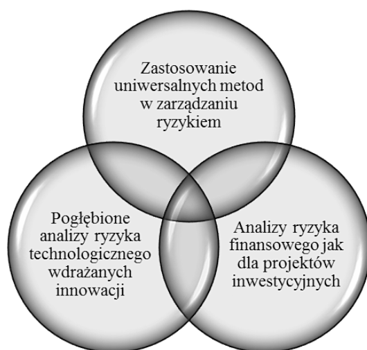
Rys. 2. Aktualny stan wiedzy odnośnie do podejść do zarządzania ryzykiem w projektach innowacyjnych

Ponadto, mając na uwadze nowatorski charakter projektów innowacyjnych, należy dodatkowo przyjąć, za D. Hillsonem [2011], nowoczesne podejście do ryzyka, dzieląc je na: